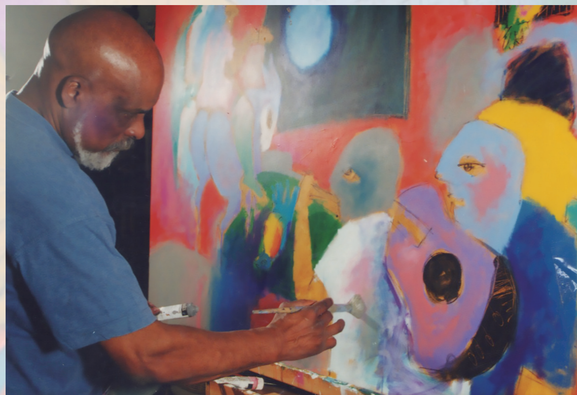
No atelier de Cascais