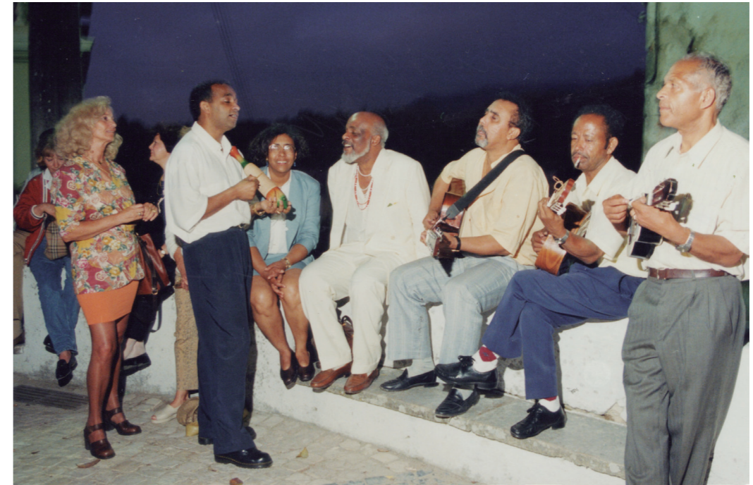
Inauguração de uma exposição na galeria de Colares, com interpretação musical cabo-verdiana