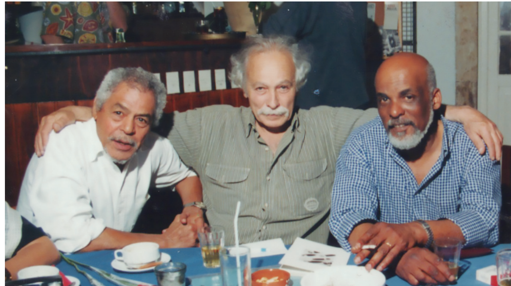
Com Ricardo Rangel (fotógrafo) e Virgílio de Lemos (poeta)